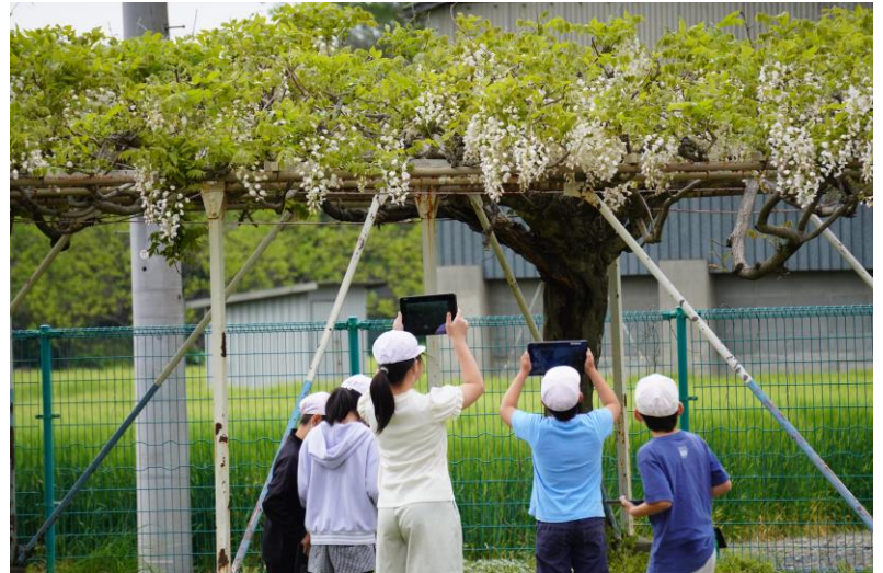
理科「春の生き物」の活動風景① 校庭の草木をタブレットで撮影しています。撮影した写真は、教室で行う観察カードへの記入に役立てていきます。