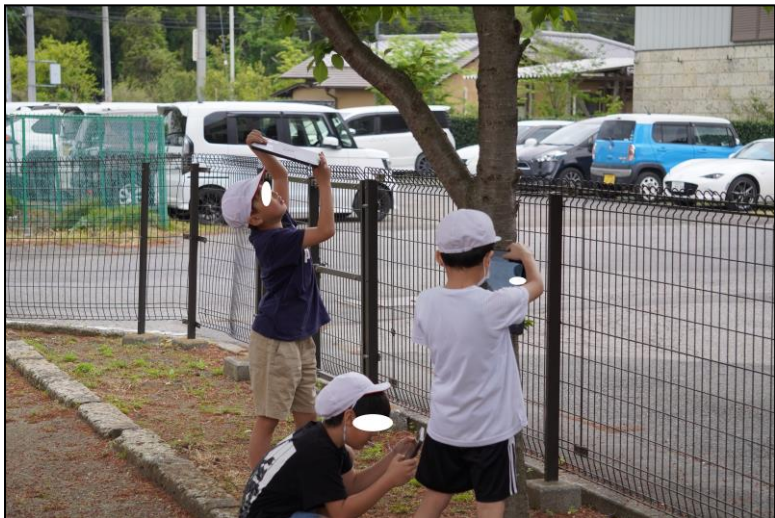
理科「春の生き物」の活動風景② 子どもたちは自分で選んだ草木を撮影します。葉・枝・木の幹まで、細かく観察していました。