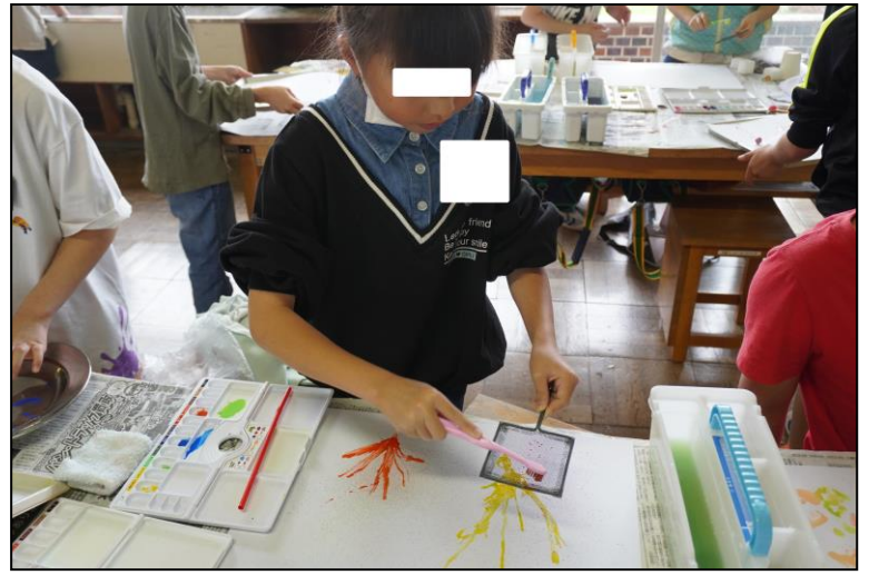
図工「絵の具のぼうけん楽しさ発見」の活動風景② 網とブラシを使い、絵の具を霧状に落としています。