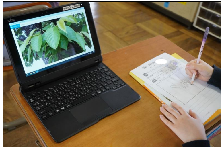
撮影後、教室に戻って観察カードに記入しました。ICT機器を活用することにより、その日の天候に左右されずにゆっくりと観察記録をまとめられることや、写真を拡大することによって、細かい部分を確認しながらより詳細に記録をまとめることができました。