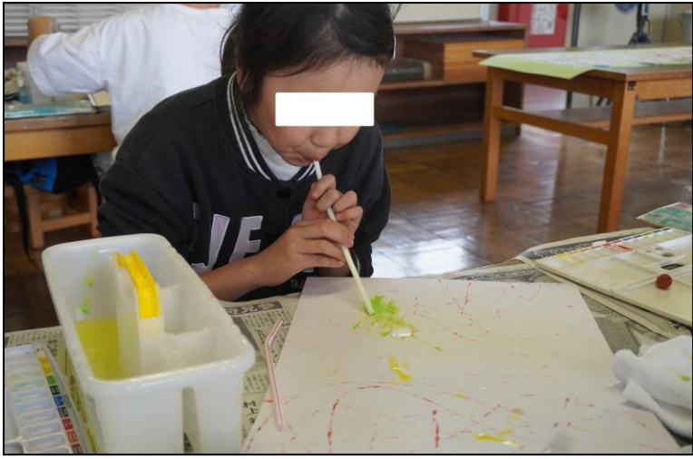
図工「絵の具のぼうけん楽しさ発見」の活動風景① ストローを使って色を広げています。